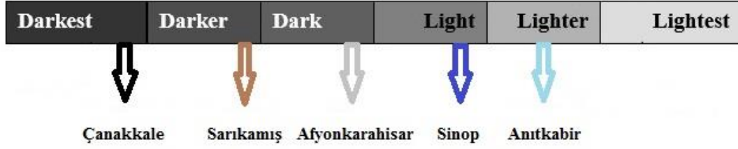
Tablo 3. Hüzün Turizmi Destinasyon Sınıflandırması Türkiye Örneği

Kaynak: Stone 2008: 88'den uyarlanarak yazar tarafından oluşturulmuştur.