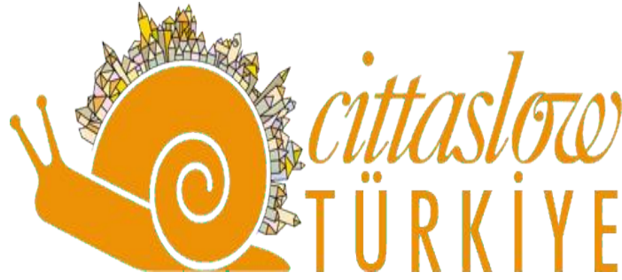
Resim 1: Cittaslow Logosu (cittaslowturkiye.org)

Hareket, logo olarak turuncu bir salyangozu kullanmıştır. Salyangozun tercih edilme sebebi yavaşlık felsefesiyle salyangozun var olma biçiminin birbiriyle ilişkilendirilmesidir. Salyangoz, hem yavaşlığın hem dinginliğin temsilidir. Bununla birlikte salyangozlar, yuvalarını sırtlarında her yere taşımakta ve gittiklerinde arkalarında izlerini bırakmaktadırlar. Salyangozun hareketlerini belirleme yetisi ve hızı, insan doğasında akıl ve ağırbaşlılığın ifade edilmiş biçimidir (Levent, 2019: 11).